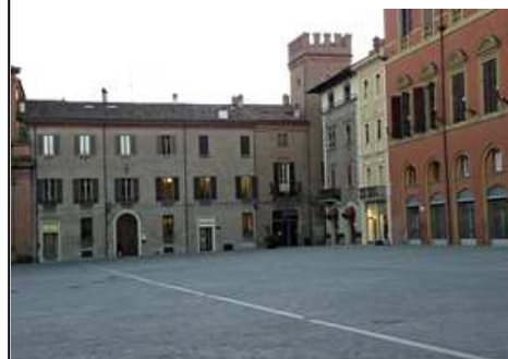
A Imola il mercatino di Natale Auser quest'anno sarà in Piazza Matteotti

Non da meno saranno impegnate le volontarie di Castel San Pietro e Osteria Grande , il 4 dicembre sarà la volta di Osteria Grande, mentre Castel San Pietro allestirà il gazebo i giorni 5,6,8,12e13 dicembre . Il ricavato delle vendite è destinato, in generi alimentari, ad anziani soli che abitano negli appartamenti protetti. Il 6 gennaio appuntamento con la Befana che donerà la calza (fatta dai volontari) agli ospiti del Centro Diurno e delle Case Protette di Castel San Pietro Dozza.